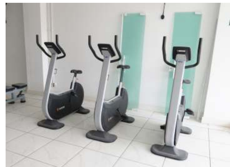
Associação adquiriu novas bicicletas ergométricas para academia

Um dos planos da diretoria da Apevo para os próximos meses é a inauguração de sua própria academia. Em julho, novos equipamentos chegaram ao local onde será a