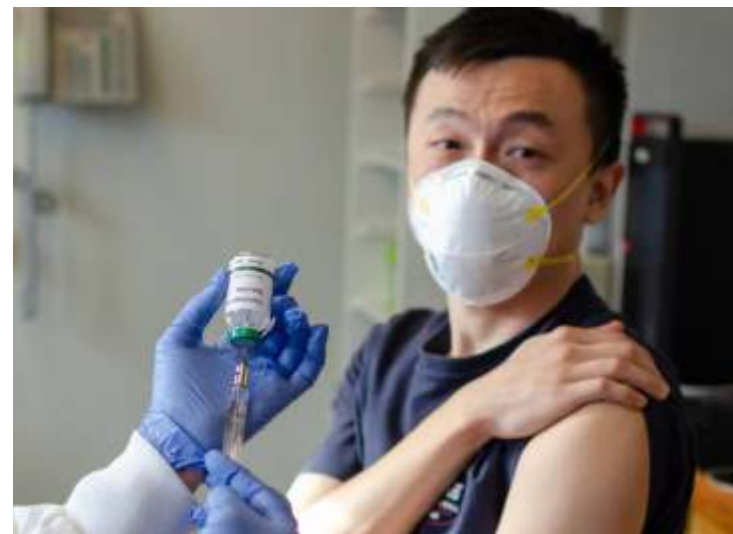
Brasil testa duas vacinas contra coronavírus

Desde o início da pandemia do novo coronavírus (Covid-19) no Brasil, em março, muito tem se especulado sobre um medicamento ou vacina capaz de prevenir contra a doença. A produção de diversos tipos de vacinas, por institutos espalhados pelo mundo todo, acendeu uma luz no fim de túnel para a população mundial, em especial para os brasileiros.