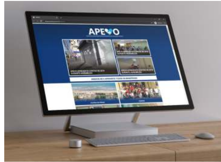
Novo layout do site da Apevo, criado pela Play Comunica

A associação está trabalhando para facilitar o acesso às informações por parte dos associados e dependentes. Além do jornal mensal, o site é uma forma de se aproximar daqueles que fazem parte do quadro associativo da Apevo.