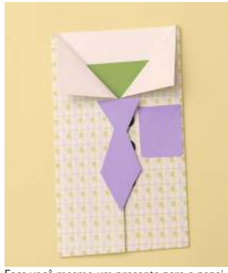
Faça você mesmo um presente para o papai

Para finalizar, cole dois botões rentes ao quadrado roxo e o seu cartão está pronto para escrever uma linda mensagem em homenagem ao “Dia dos Pais”.