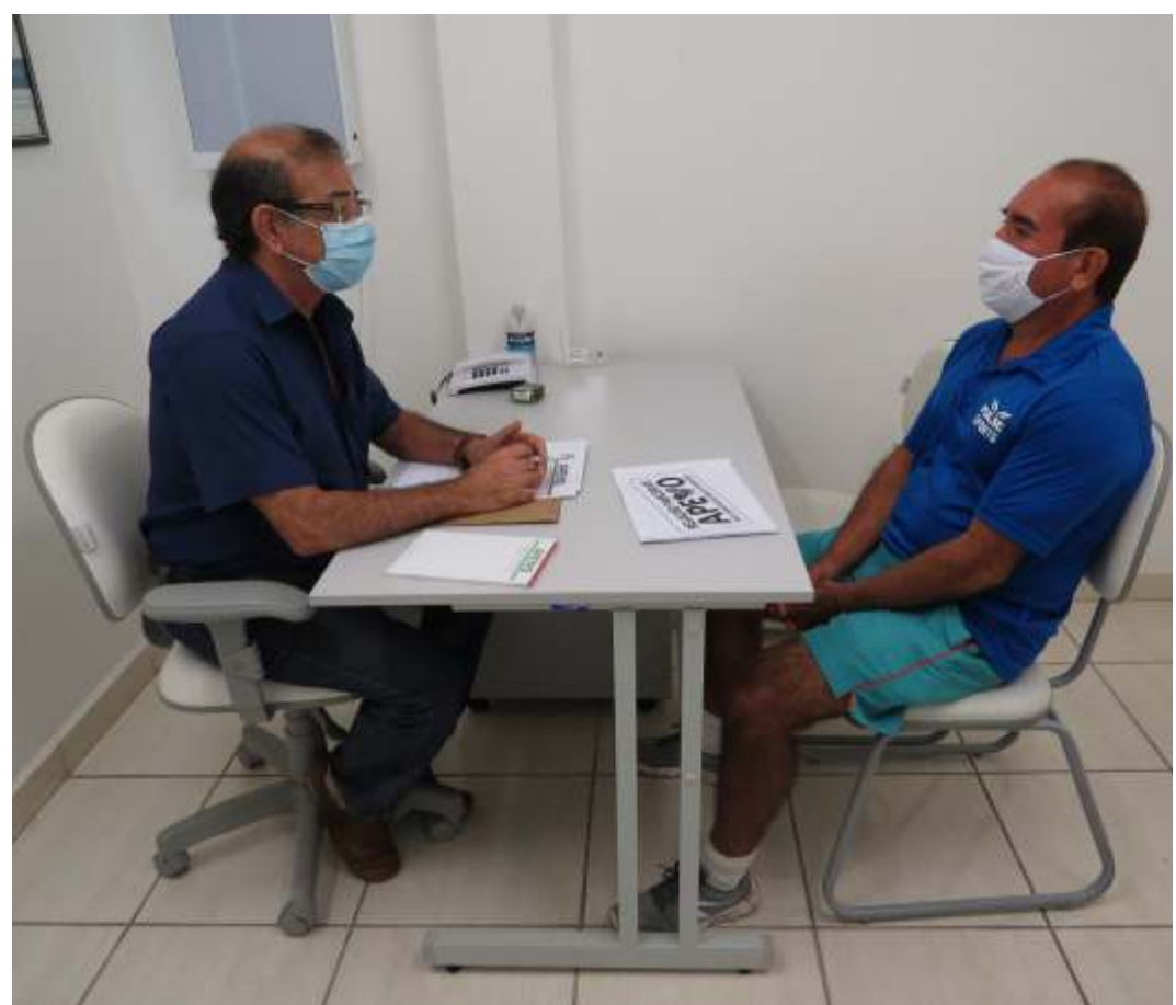
Com medidas de prevenção, diversas especialidades estão em atendimento na Apevo