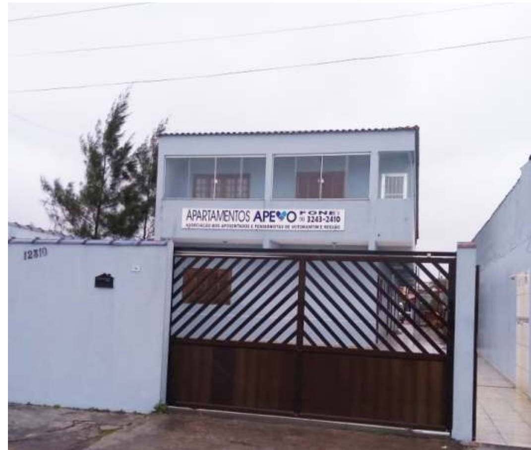
Cinco novos apartamentos foram construídos e os demais passaram por reforma