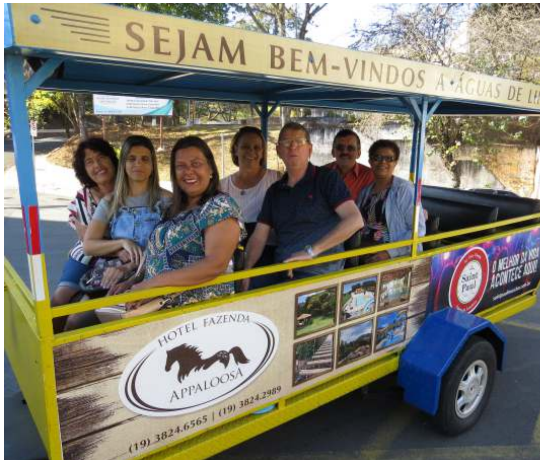
Passeio de trem, compras e bailes temáticos fazem parte da programação do passeio