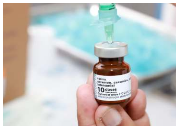
Crianças e adultos devem ser imunizadas contra o sarampo

O Ministério da Saúde alerta a população quanto à importância da vacinação, mesmo com a pandemia do novo coronavírus (Covid-19). O sarampo é uma doença grave e de alta transmissibilidade. Uma pessoa infectada pode transmitir para até outras 18 pessoas.