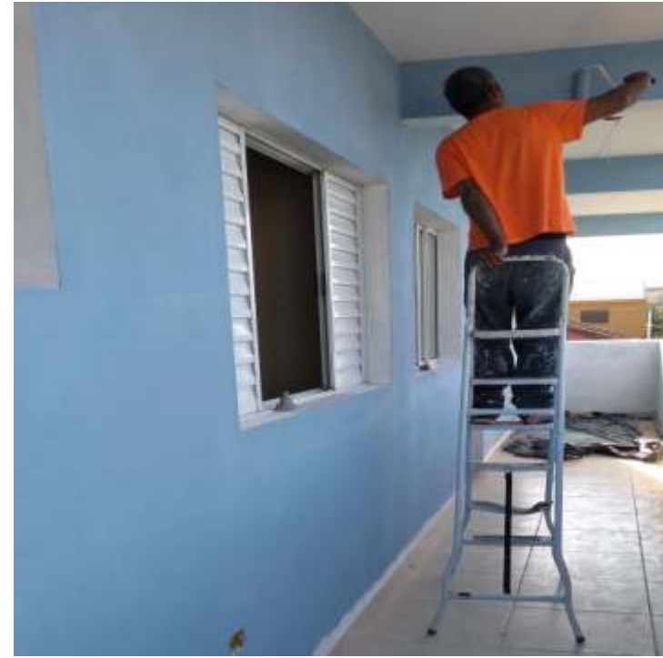
Apartamentos ganharam nova pintura externa e interna