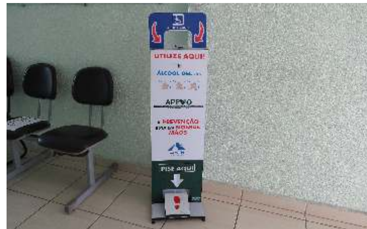
Associação ganhou display de álcool em gel

gel, na concentração 70%, é capaz de matar o vírus porque age em suas membranas e proteínas de forma rápida.