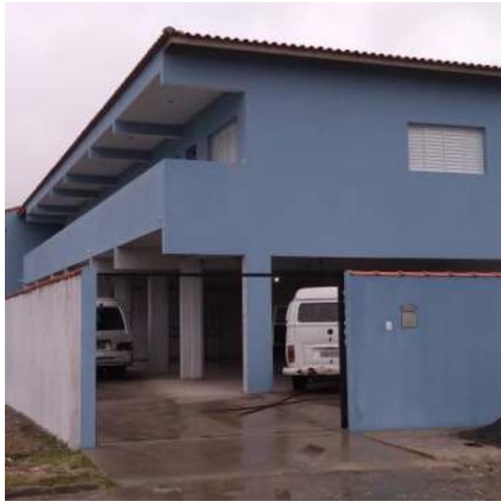
Obra deverá ser finalizada nos próximos meses